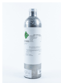
Bombola gas Chiedere la disponibilità