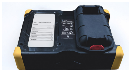
WatchGas SST Docking Station for SST1/SST4/SST4 Pumped Touch screen PN: SST-Dock