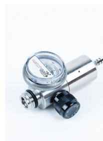
Fixed flow Regulator stainless Steel 715 0.5LPM PN: A0299024 Fixed flow Regulator 715 0.5LPM (Brass) PN: A0195339